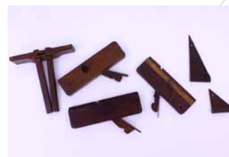
Museu Histórico da Imigração Japonesa no Brasil