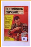
Revista Eletrônica Popular