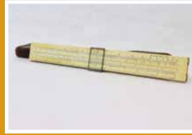
Régua de cálculo