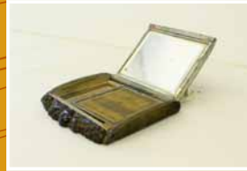
Estojo de maquiagem