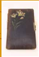
Caderno de recordações