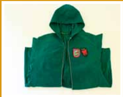
Casaco impermeável com capuz