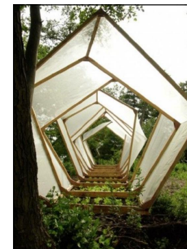
IMAGEM DE REFERÊNCIA TÚNEL